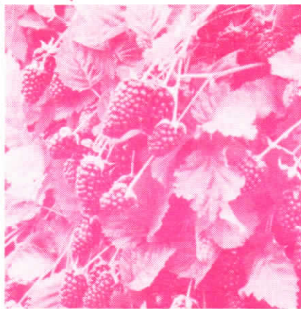
Appétissantes n'est-ce pas?