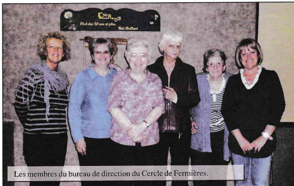
Les membres du bureau de direction du Cercle de Fermières.

En mars, une journée de la semaine de relâche a été consacrée aux enfants. Des cours de tricot, de peinture et d'artisanat leur ont été offerts.